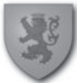
Ailly sur Noye / Frankreich