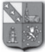
L'Hopital / Frankreich