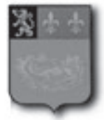
Le Havre / Frankreich